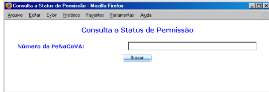
Figura 1 - Tela Inicial

Uma saída possível para o sistema é apresentada na figura 2: